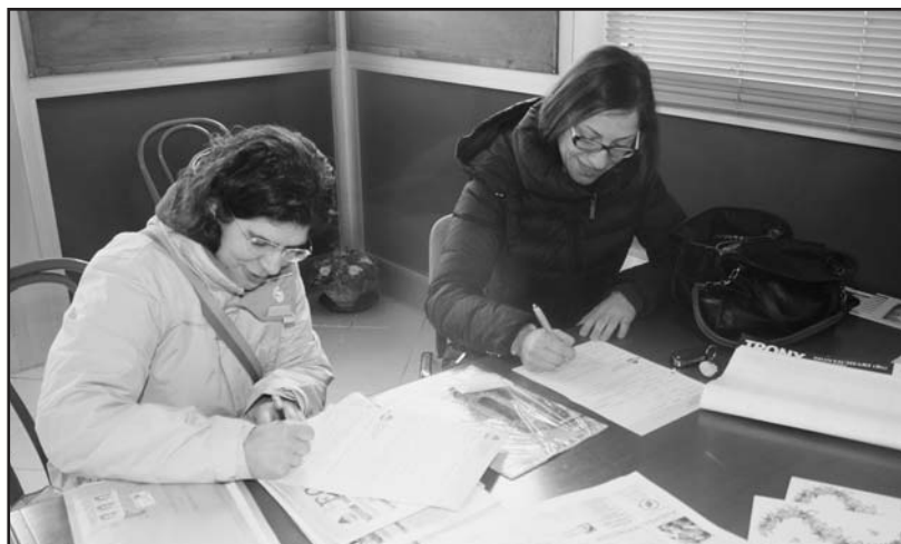
Il momento dell'iscrizione all'Aido.

E' questa la volta dello sportivo GIOVANNI SOLDINI, noto per le sue mitiche imprese negli oceani: "La donazione de-