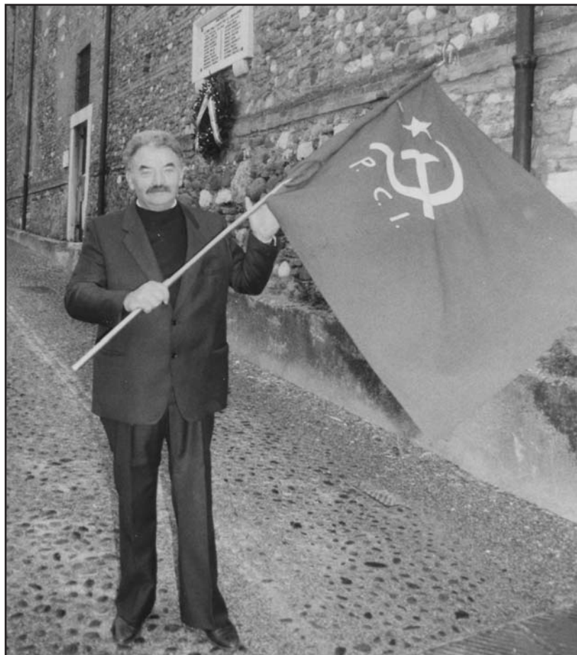
Come Riccardo desiderava essere ricordato.