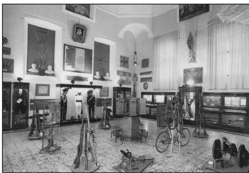
L'interno del museo.